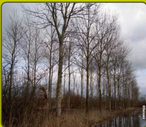
Achat à Hautrage

Un grand merci donc à tous nos généreux donateurs !