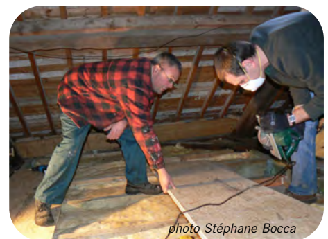
Notre équipe de travailleurs à l'ouvrage