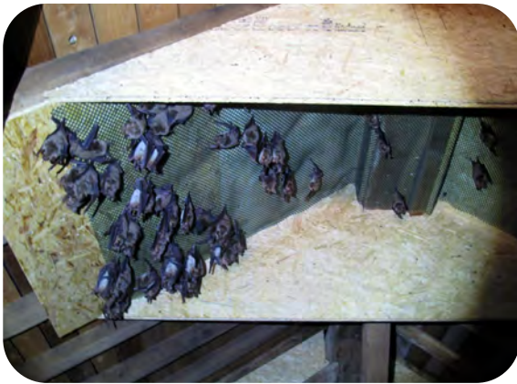
Grands murins dans une hotbox

Dans un prochain numéro de l'Écho des Rhinos, nous vous ferons découvrir l'aménagement d'une "maison à chauves-souris" à Virton (les plus curieux d'entre vous peuvent déjà aller jeter un coup d'œil sur www.interreg-lorraine.eu ).