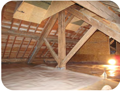
Aperçu du grenier après les travaux

Nous retournons sur place le 30 mai 2012, avec un peu d'appréhension vu l'absence des chauves-souris à la mi-août 2011. Dès notre arrivée à proximité du bâtiment, des petits cris nous rassurent : elles sont bien de retour. L'odeur de la colonie n'est plus perceptible que dans le grenier et une centaine de Grands murins nous fait même l'honneur d'occuper une hotbox. Au total, sur base de photos prises rapidement lors de la visite, l'effectif de la colonie est estimé à 250 individus. Il s'agit très certainement d'une partie de la colonie anciennement présente dans l'abbaye d'Orval, qui comptait 800 individus en 2003. Cette colonie a déserté l'abbaye en 2008 en raison de l'intrusion de fouines et seules quelques dizaines d'individus avaient pu être retrouvées jusqu'à présent, dans des gîtes précaires.