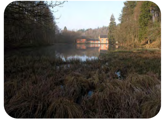
Propriété abritant la colonie de Grands murins

L'histoire débute le 15 juin 2011, au cours d'une visite de contrôle de plusieurs bâtiments aménagés pour les chauves-souris dans le cadre du projet INTERREG IVa Lorraine. À Meix-devant-Virton, une ferme abrite quelques Petits rhinolophes dont certains ont adopté, pour notre plus grande satisfaction, la hotbox mise à leur disposition un an plus tôt (voir l'Echo des Rhinos n°57 et 60). Heureux du succès de cet aménagement, nous 1 engageons la conversation avec une dame de passage à la ferme qui nous dit avoir habité plusieurs années à proximité d'une importante colonie de chauves-souris. Le site, un complexe de bâtiments abritant notamment une ancienne forge, est situé également sur la commune de Meix-devant-Virton, dans une vallée en bordure de la forêt d'Orval.