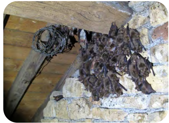
Grappe de Grands murins sur le pignon